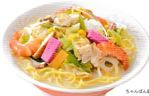
ちゃんぽん調理例